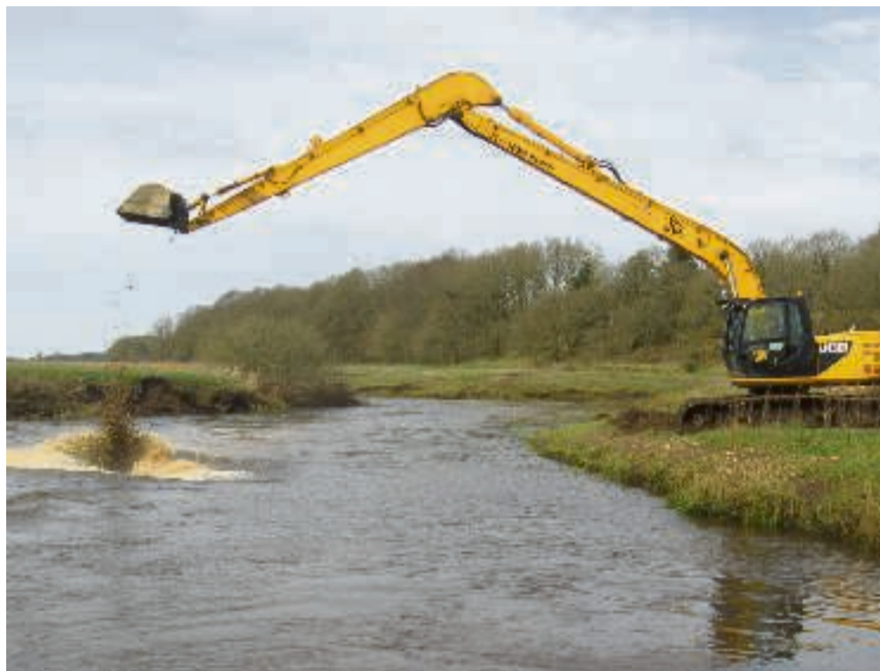
Der udlægges gydegrus ved Burgård i foråret. Pressebillede

Det er også afgørende, hvor mange små to år gamle laks (smolt), der er trukket ud af Storå, er nået op til opvækstområderne i Nordatlanten og