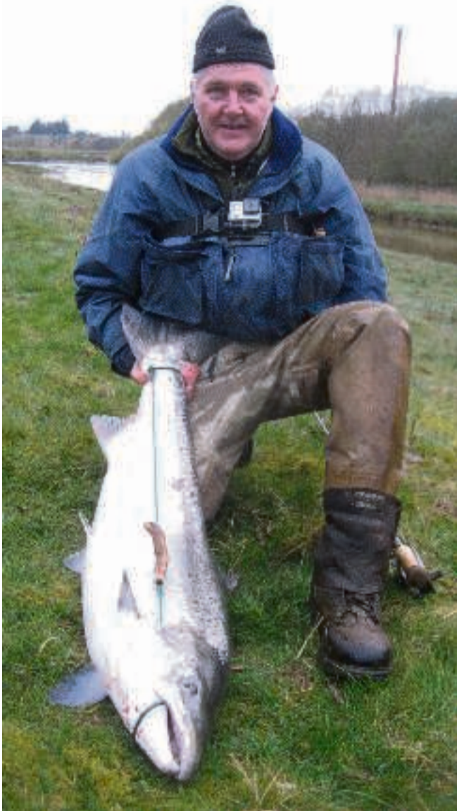
Laksen her er fanget af Peter Wadmann den 16. april 2016. Pressebillede

På grund af de statsligt fastsatte kvoteregler, er de 1100 ud